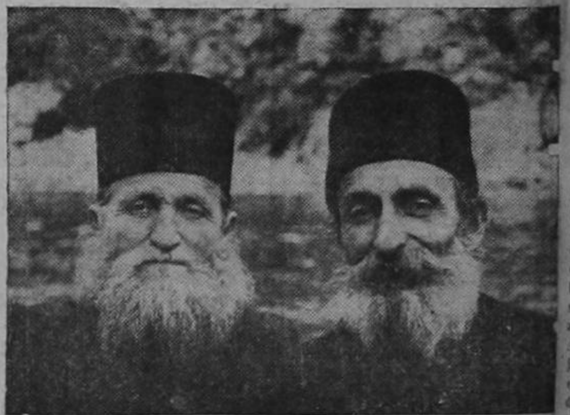
La mayoría de la población de Athos la constituyen monjes viejos. En la actualidad son raros los jóvenes que van a los monasterios, pero para todos es la regla: barbas y cabellos largos.