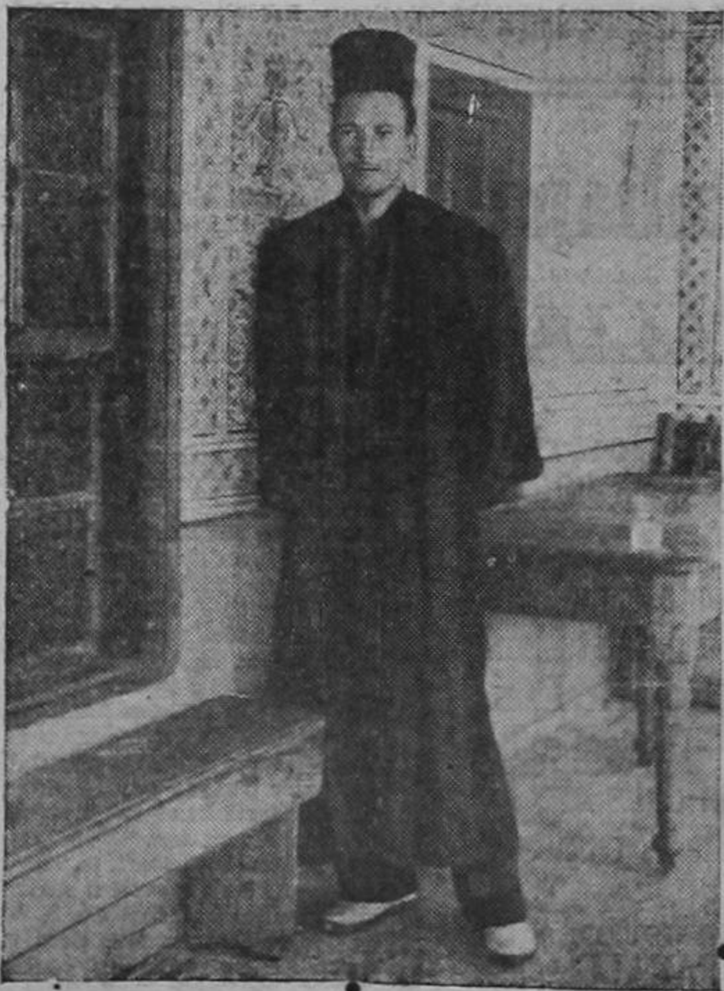
Richard Halliburton vestido de monje (menos los zapatos).

Recuerda muy bien uno de esos casos, durante mi permanencia en Athos. Pasa a la Pág. DIECIOCHO